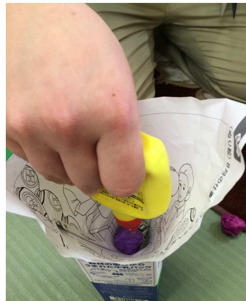
③作った実をひとつづつ入れ、ボンドを落としながら増やしていきます