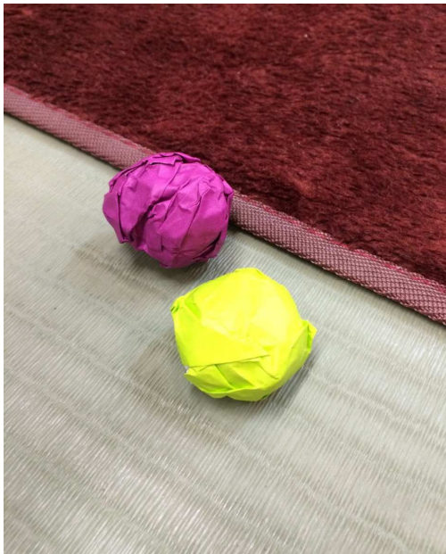
①丸めた新聞紙に色紙を巻き、実を作ります